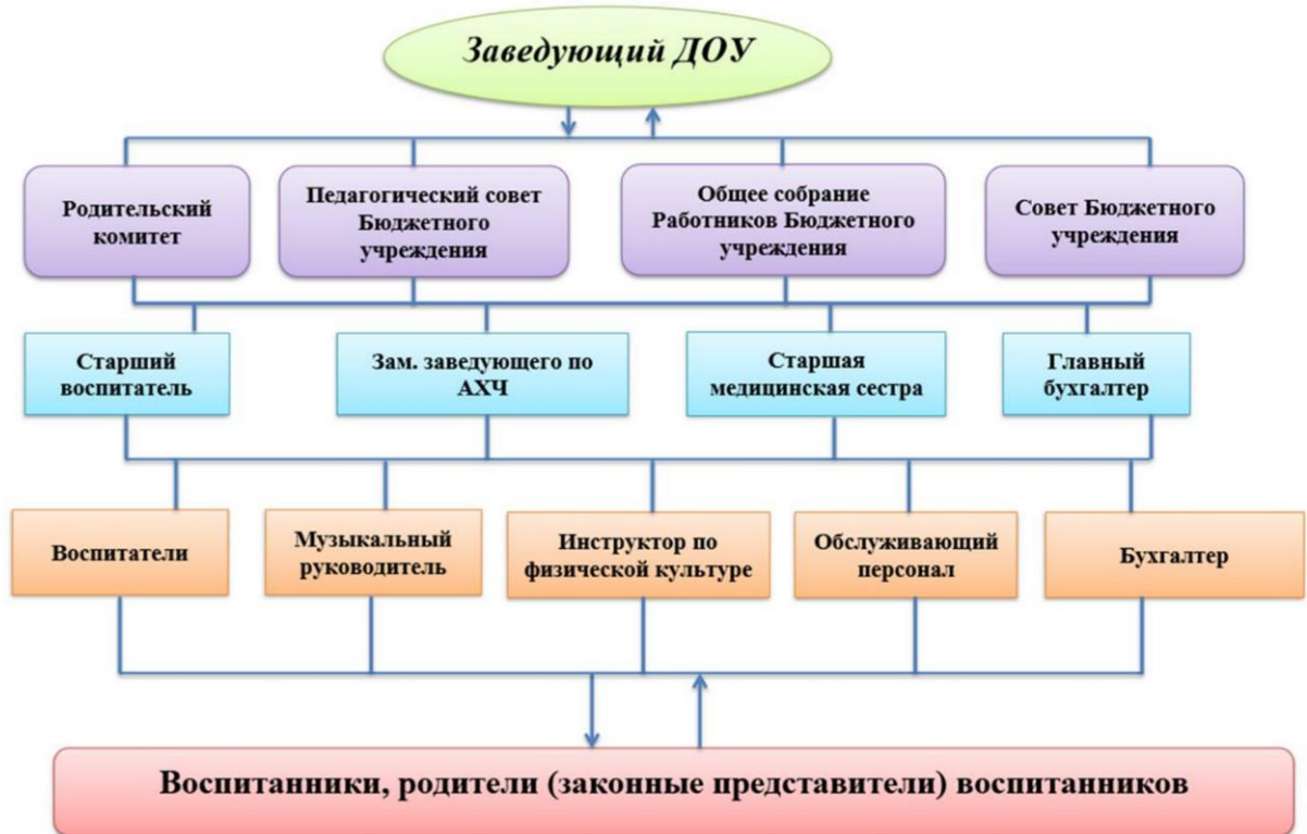
Структура и органы управления МБДОУ «Детский сад № 260» г.о. Самара

Все функции управления (прогнозирование, программирование, планирование, организация, регулирование, контроль, анализ, коррекция) направлены на достижение оптимального результата. Планируется расширение внешних связей с различными структурами.